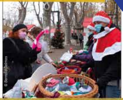
Grâce au chalet solidaire, des créations originales vendues pour une action caritative