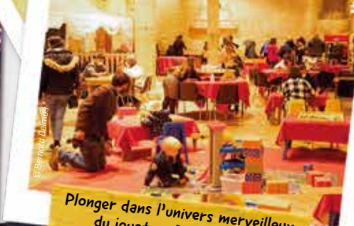
Plonger dans l'univers merveilleux du jouet au Palais du Jeu