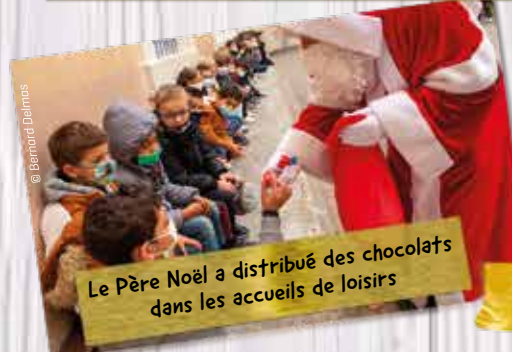
Le Père Noël a distribué des chocolats dans les accueils de loisirs