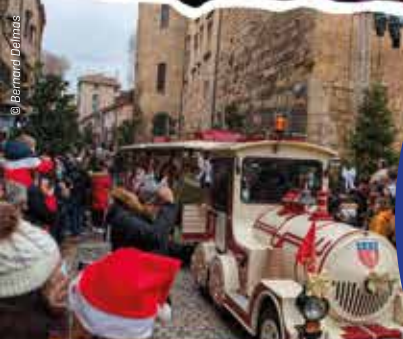
Le 24, le Père Noël a débuté sa tournée en petit train