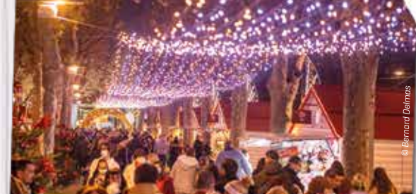
Se faire plaisir ou faire plaisir au Village de Noël