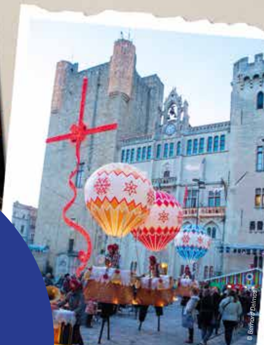
Un superbe voyage en montgolfière sur la place de l'Hôtel-de-Ville !