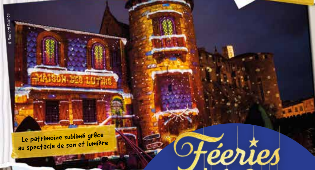
Le patrimoine sublimé grâce au spectacle de son et lumière