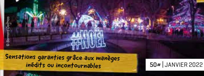
Sensations garanties grâce aux manèges inédits ou incontournables