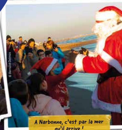
A Narbonne, c'est par la mer qu'il arrive !