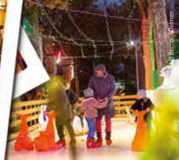
Sur la patinoire synthétique, des plus belles figures aux plus belles chutes...