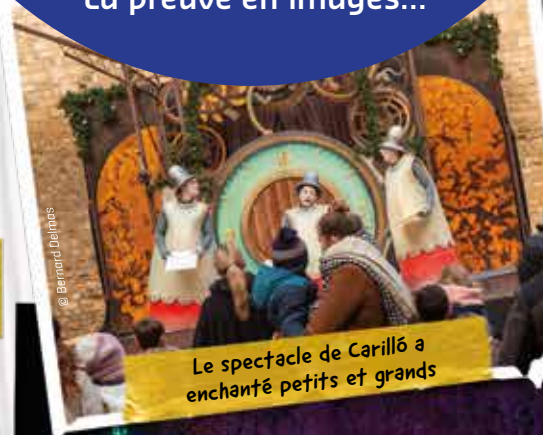
Le spectacle de Carilló a enchanté petits et grands