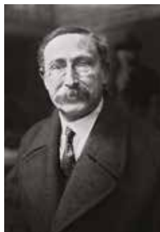
figure nationale du Front Populaire en 1936, était député de la circonscription de Narbonne de 1929 à 1940 . Il laisse une trace indélébile de son passage dans la mémoire locale.