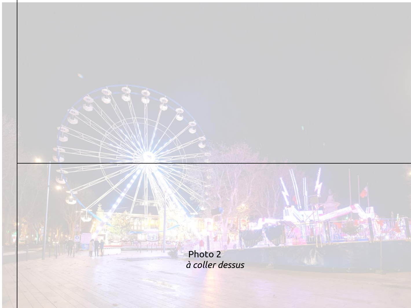
Photo 2 à coller dessus